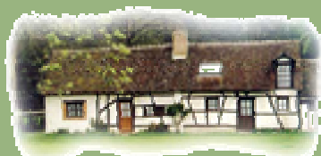
«Le Domaine du Boulay »