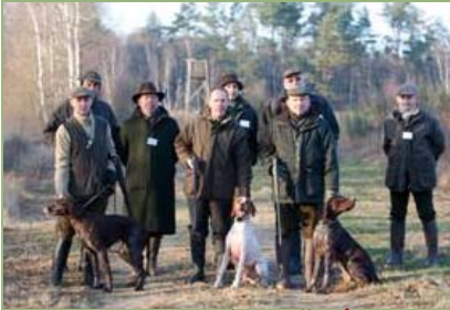
Barrage Chiens d'arrêt