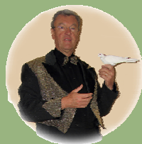
Dîner Spectacle « Domaine de la Grande Garenne »