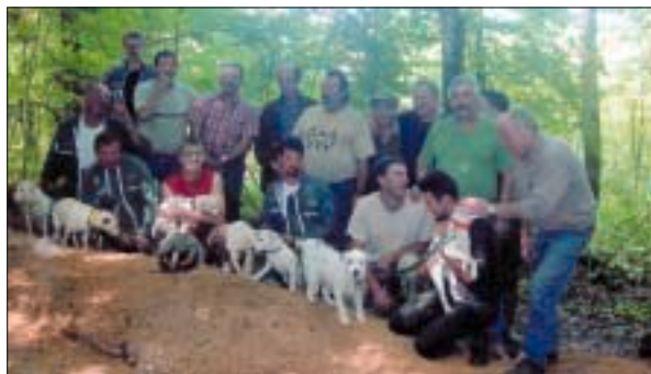
Le rallye Véronique entouré de chasseurs de Grancey-sur-Ouche.