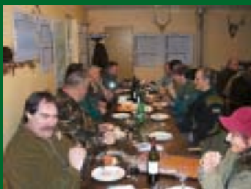
Le débriefing, a été suivi d'un repas, histoire de respecter la tradition.

et Gevrolles. À noter que la DDAF et l'ONCFS apportent leur concours à ces opérations, en mettant à disposition des agents. Le matériel est essentiellement fourni par la FDC 21. Il est prévu, outre l'apport des projecteurs, la mise à disposition par les chasseurs, d'un certain nombre de véhicules 4x4. Chaque opération, avec la participation active des administrateurs de la FDC 21, fait l'objet d'une préparation rigoureuse de la part du service technique de cette même fédération. À noter que, préalablement au déclenchement de ce type d'opération, toutes les mairies, tous les présidents des sociétés de chasse et brigades de gendarmerie du secteur concerné sont avisés.