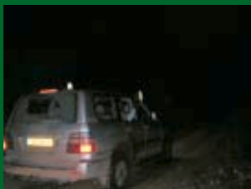
À l'arrière du véhicule, prennent place deux personnes qui dirigent les projecteurs. Ces deux intervenants ont un rôle plus important qu'on ne l'imagine, car il faut avoir « le coup de pinceau régulier » pour bien balayer le terrain et repérer les animaux.