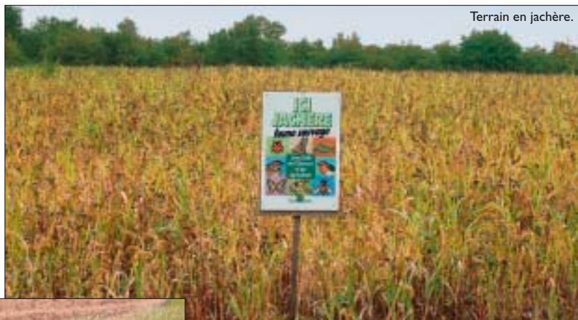
Terrain en jachère.

Ces GIC ont évidemment été créés avec le concours de la FDC21 par l'intermédiaire de ses techniciens et administrateurs. De nombreux aménagements ont déjà été conçus, notamment des points d'eau,