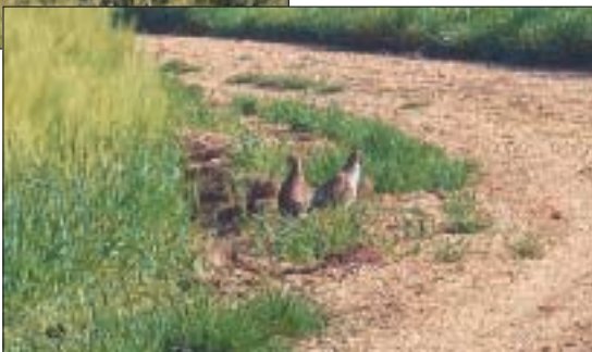
Un couple de perdrix

Des comptages réalisés sur le GIC « du Val de Saône » ont permis de recenser, début mai, 46 coqs faisans chanteurs sur environ 480 ha de plaine, ce qui laisse présager d'une population importante.