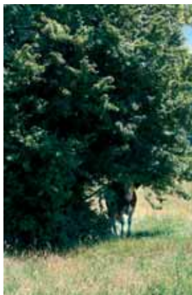
Les haies représentent une protection pour le bétail (ombre et coupe-vent).

Pour vous aider à cerner les caractéristiques de votre haie, trois éléments doivent être pris en compte. Premièrement, déterminez les fonctions attendues (cf. Chasseur de l'Est n° 112), ensuite, pen-