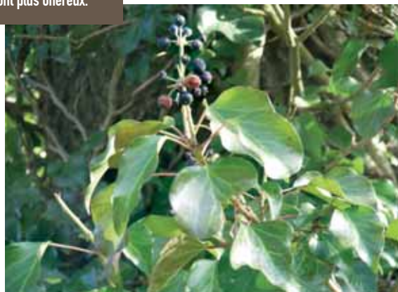
Le lierre, source potentielle de nourriture en hiver.

sez à son intégration dans le lieu d'implantation et enfin définissez le temps et les moyens que vous pourrez consacrer à l'entretien (cf. Chasseur de l'Est n° 113). Les deux premières réflexions sont à mener de front car les rôles de la haie sont liés à sa localisation et à son intégration dans un réseau de haies existantes. Attention, le site d'implantation peut impliquer des facteurs limitants qui doivent être anticipés ! Parmi eux, il y a le choix des essences (il est essentiel de déterminer une liste des essences possibles), la période d'accessibilité, l'impact sur le paysage et sur les parcelles adjacentes. Une haie peut avoir des fonctions différentes. Elle peut être hydrologiquement active par exemple. Lorsqu'elle est située en tra-