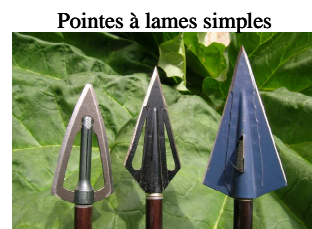
pointes grand gibier