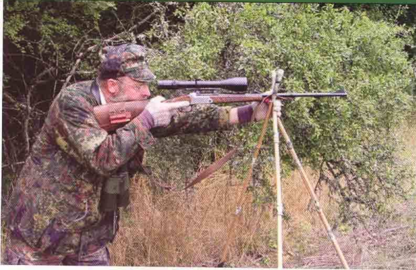
Position de tir avec canne de pirsch.

• couteau (il faut vider son gibier tué rapidement); • une lampe torche; • une poire à talc (pour apprécier d'où vient le vent); • du papier biodégradable afin de baliser, en cas de blessure de l'animal, la zone de terrain qui permettra une recherche au sang.