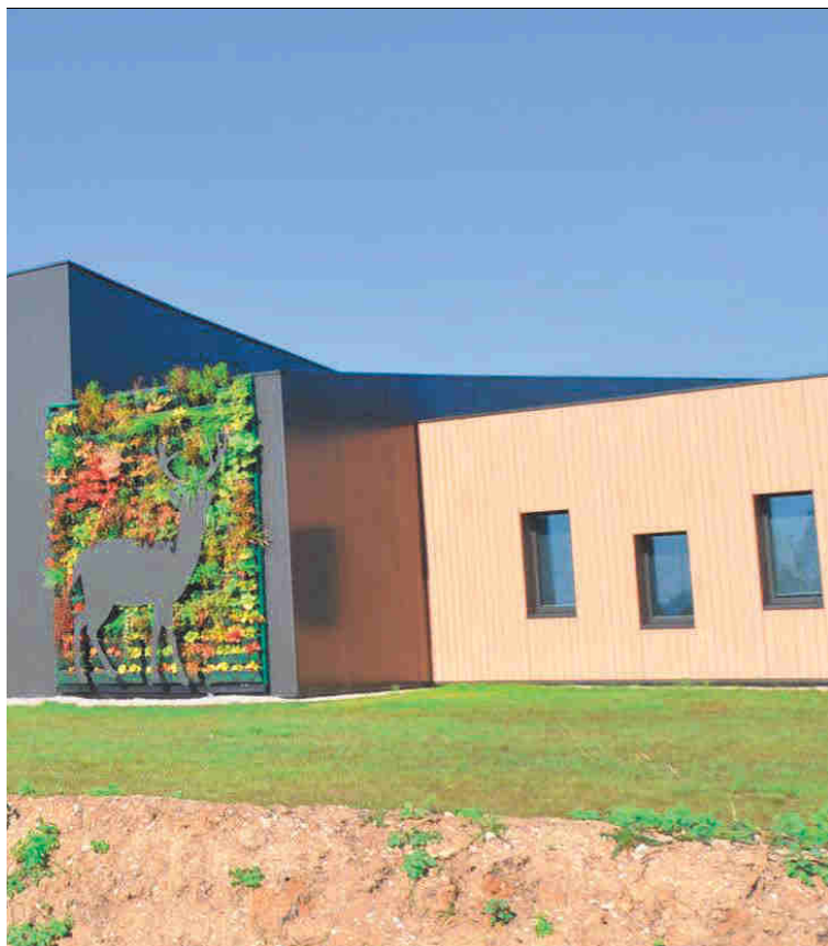
nature, et son mur végétal, imaginée par le cabinet d'architecture Arkos.