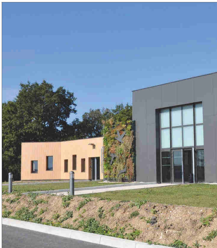
■ À Norges-la-Ville, le long de la D105, la nouvelle Maison de la chasse et de la